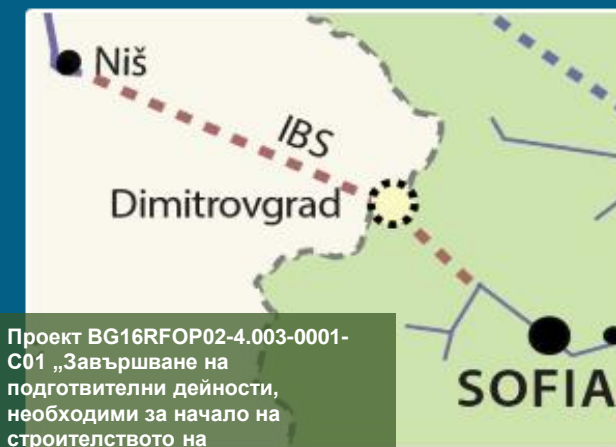
Проект BG16RFOP02-4.003-0001-C01 „Завършване на подготвителни дейности, необходими за начало на строителството на Междусистемната газова връзка България – Сърбия“