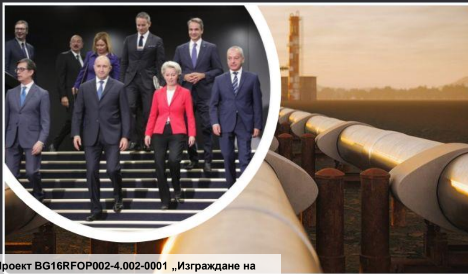
Проект BG16RFOP002-4.002-0001 „Изграждане на междусистемна газова връзка Гърция-България“

Със средства по ОПИК са изградени 29,6 км. от газопровода на територията на България. Междусистемната газова връзка Гърция – България е проектирана за пренос на природен газ между двете страни чрез свързване на газопреносителните им мрежи. Общата дължина на газопровода е 182,5 км., от които 31,6 км. на територията на Гърция и 150,9 км. - на територията на България.